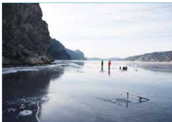
Isfiske på Gullmarsfjorden omgiven av dess dramatiska strandlinje en vacker vinterdag.