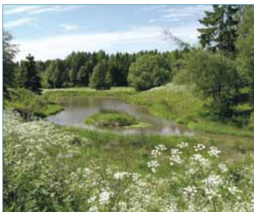
En våtmark i Färgelanda kommun som har anlagts för att minska övergödningen och gynna den biologiska mångfalden.

Vattendirektivets mål är att alla vatten inom EU ska ha god status. Enligt Länsstyrelsens bedömning av Örekilsälvens sjöar och vattendrag har bara knappt hälften av dem god ekologisk status. Orsakerna till detta är problem med försurning, övergödning, vandringshinder för fisk och annan fysisk påverkan så som flottledsrensningar och dikningar. Men det finns också problem med miljögifter och främmande arter i vattensystemet, så som signalkräfta och amerikansk bäckröding. Det behövs därför åtgärder för att minska utsläpp av vattenföroreningar, återställa och bevara värdefulla vattenmiljöer och inte minst att alla som bor och verkar i området visar god vattenhänsyn i sin vardag!