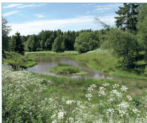
En våtmark i Färgelanda kommun som har anlagts för att minska övergödningen och gynna den biologiska mångfalden.

Vattendirektivets mål är att alla vatten inom EU ska ha god status. Enligt Länsstyrelsens bedömning av Örekilsälvens sjöar och vattendrag har bara knappt hälften av dem god ekologisk status. Orsakerna till detta är problem med försurning, övergödning, vandringshinder för fisk och annan fysisk påverkan så som flottledsrensningar och dikningar. Men det finns också problem med miljögifter och främmande arter i vattensystemet, så som signalkräfta och amerikansk bäckröding. Det behövs därför åtgärder för att minska utsläpp av vattenföroreningar, återställa och bevara värdefulla vattenmiljöer och inte minst att alla som bor och verkar i området visar god vattenhänsyn i sin vardag!