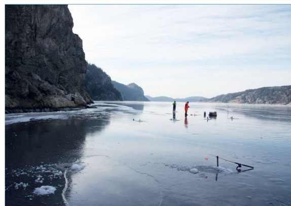
Isfiske på Gullmarsfjorden omgiven av dess dramatiska strandlinje en vacker vinterdag.